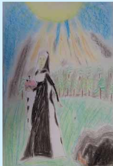
Maciej Klimczak , kategoria wiekowa klasy od 4 do 6, miejsce III