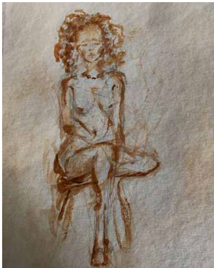
Rysunek Wiktoria Kozielec

dostać Wiktorii do programu? – W mediach społecznościowych zobaczyłam, że jest ca-