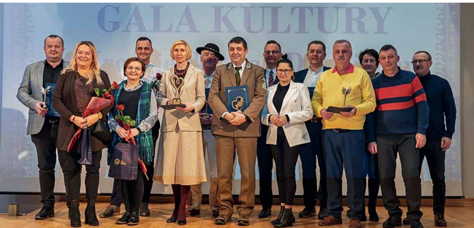
Odznaczeni i radni