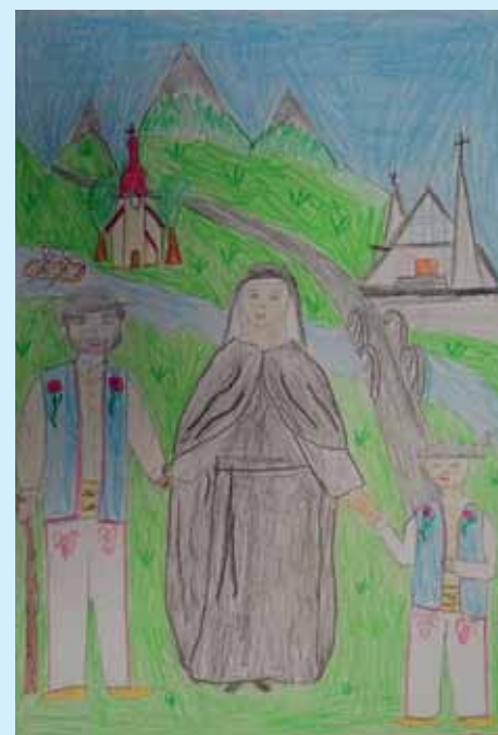
Zuzanna Hryc , kategoria wiekowa klasy od 1 do 3, nagroda specjalna przewodniczącej komisji oświaty, kultury i zdrowia