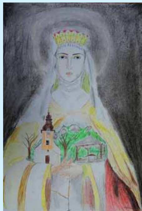
Aleksandra Sysiak , kategoria wiekowa klasy od 7 do 8, miejsce I