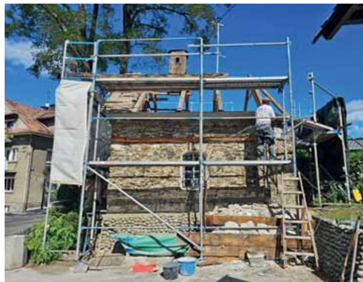
Tak wyglądał remont